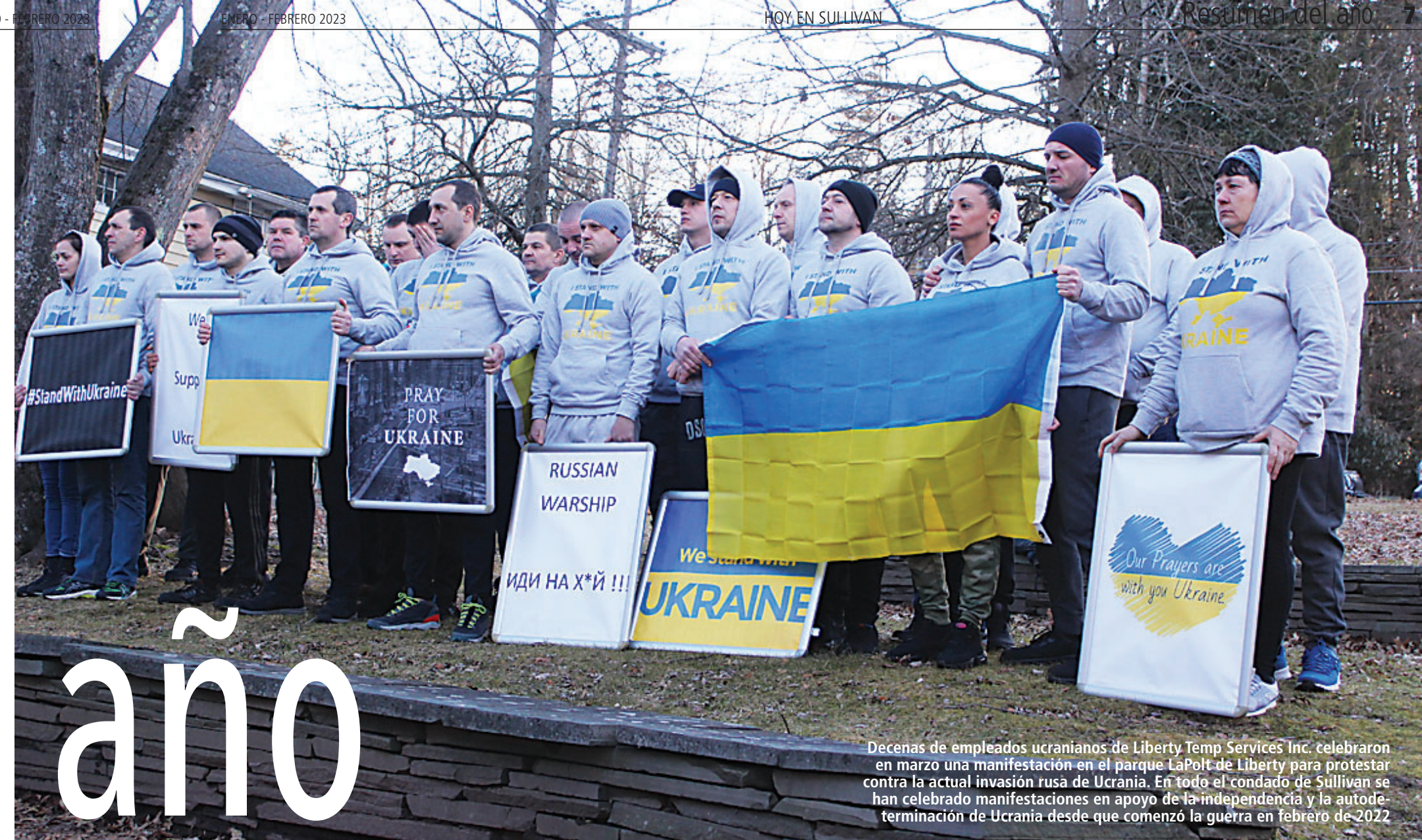
Decenas de empleados ucranianos de Liberty Temp Services Inc. celebraron en marzo una manifestación en el parque LaPolt de Liberty para protestar contra la actual invasión rusa de Ucrania. En todo el condado de Sullivan se han celebrado manifestaciones en apoyo de la independencia y la autodeterminación de Ucrania desde que comenzó la guerra en febrero de 2022.

Las oficinas de distrito del NYSDOH hacen cumplir la normativa que protege la salud pública, la seguridad y el medio ambiente en relación con los alimentos, el agua y la calidad del