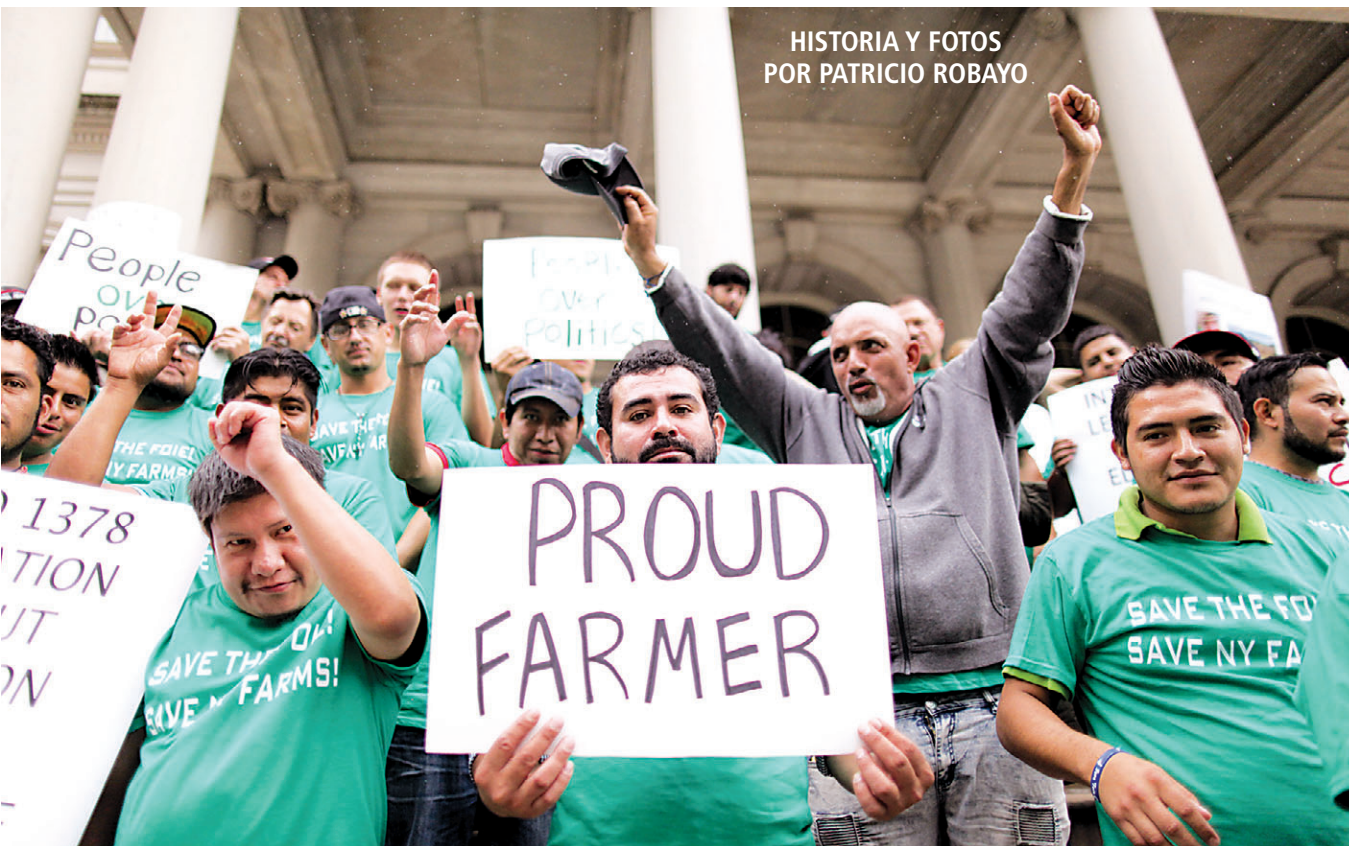
HISTORIA Y FOTOS POR PATRICIO ROBAYO

El Departamento de Agricultura del Estado considera que se infringe la ley de Nueva York