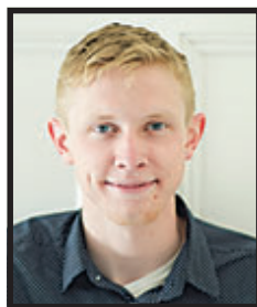
Matt Shortall Editora