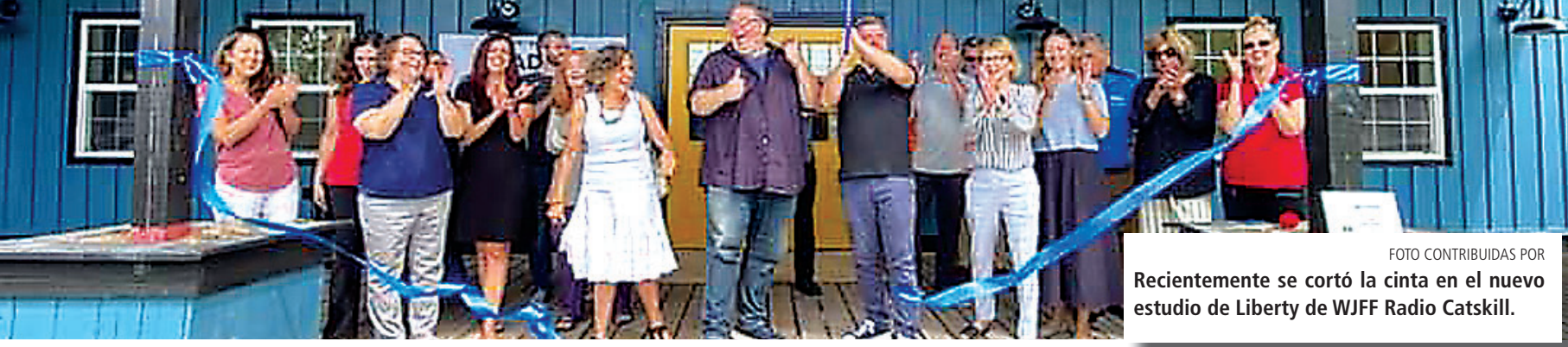
FOTO CONTRIBUIDAS POR Recientemente se cortó la cinta en el nuevo estudio de Liberty de WJFF Radio Catskill.