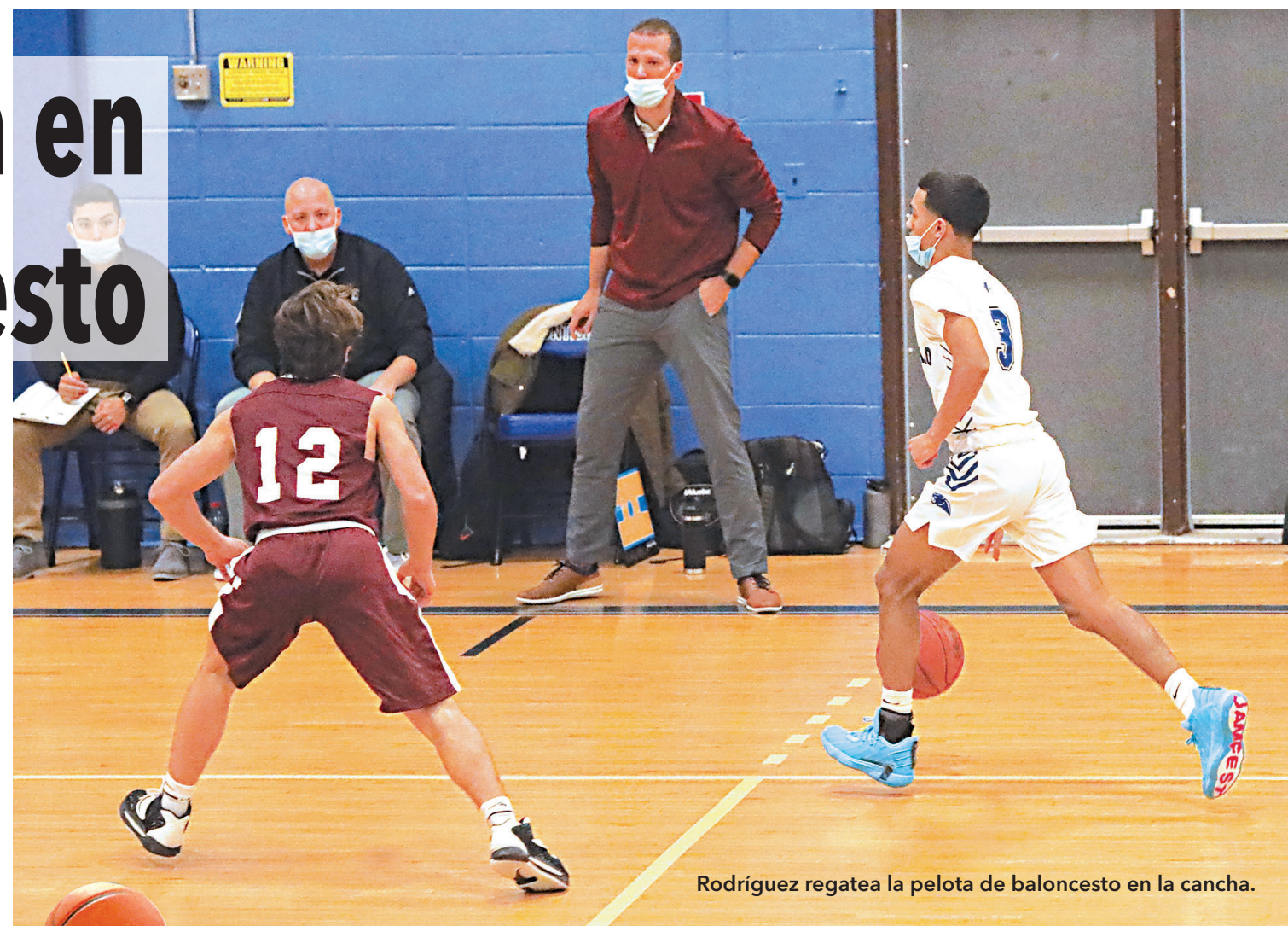
Rodríguez regatea la pelota de baloncesto en la cancha.