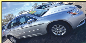
2012 CHRYSLER 200 TOURING SEDAN $9,895