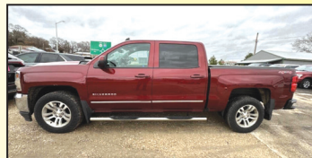
2017 CHEVROLET SILVERADO 1500 LT CREW CAB $23,855