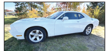
2013 DODGE CHALLENGER SXT COUPE $12,795