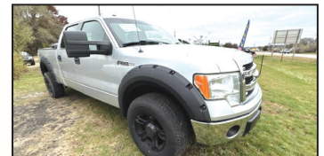
2013 FORD F-150 XLT CREW CAB $12,995