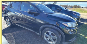
2017 HONDA HR-V EX CROSSOVER $12,350