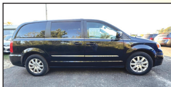
2015 CHRYSLER TOWN AND COUNTRY TOURING PASSENGER $6,999