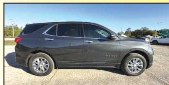
2018 CHEVROLET EQUINOX LT SUV $12,595