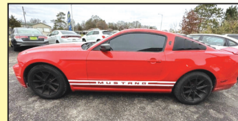
2013 FORD MUSTANG V6 COUPE $8,999